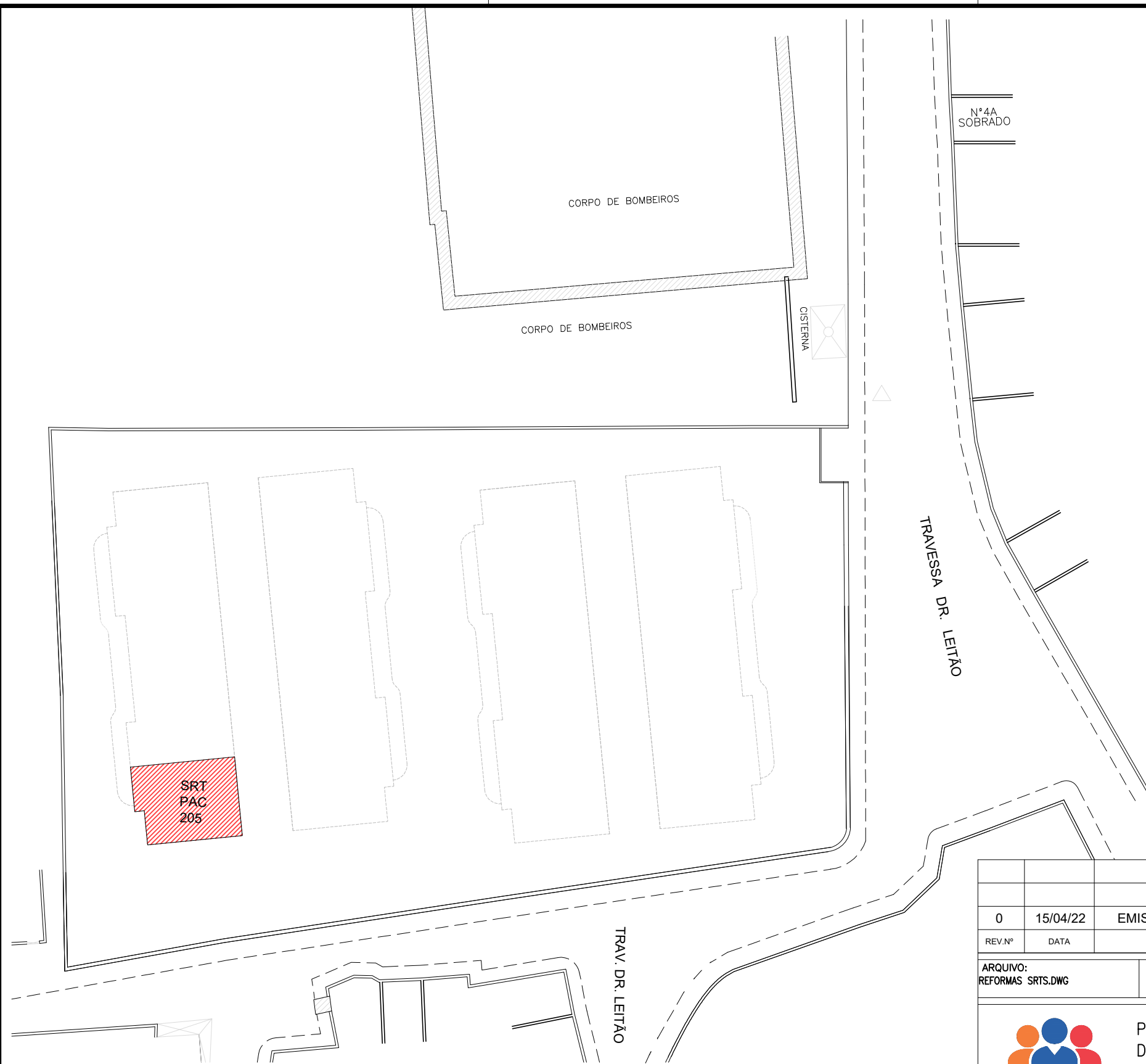
ENTRADA DE AGUA - BLOCOS BOMBEIRO ESCALA 1 / 250